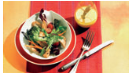
Ist schnell zubereitet, schmeckt köstlich und sommerlich leicht und ist ideal für eine ausgewogene Ernährung: Zucchini-Melonen-Salat mit knackigen Putenbruststreifen.

bau von körpereigenem Eiweiß genutzt werden kann und lange sättigt. Dabei ist es fett- und kalorienarm und daher besonders geeignet für einen ausgewogenen Speiseplan. Wer sich bewusst ernähren möchte, der sollte vor allem darauf achten, dass er möglichst abwechslungs-