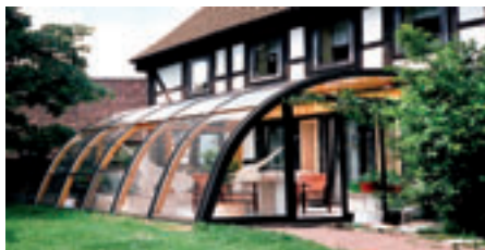
Für Neu- und Altbauten ein ungewöhnlicher Anblick: das runde Glashaus im Garten.

Das Gartencabrio hat seinen Ursprung in den 80er-Jahren. Die Verwendung von Holzleimbändern und geschwungenen Aluminium-Profilen machte es möglich, die Idee in die Praxis umzusetzen. Auch die heutigen Weiterentwicklungen gehen auf das patentierte Verfahren zurück. Den unterschiedlichen Anforderungen kommt dabei die Vielseitigkeit des Systems zugute: Denn die pfiffige Konstruktion lässt sich nicht nur für schöne Wintergärten, sondern auch für die Dachterrassen- oder Balkonaufwer-